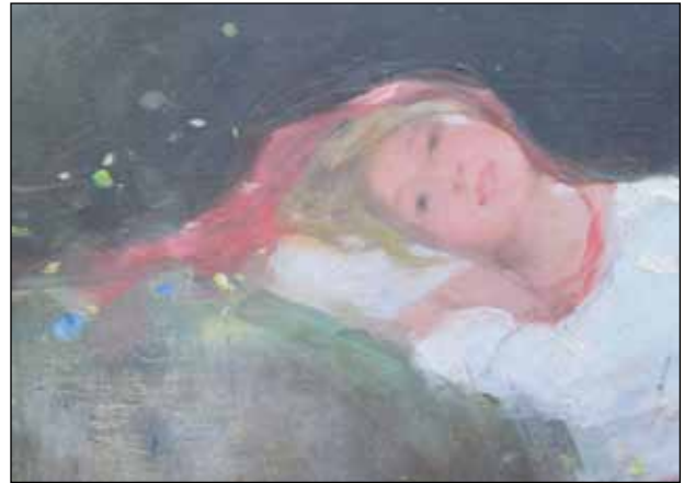
29. Fată pe gânduri (ansamblu și detaliu) Ulei pe pânză; 59 cm x 31,2 cm Semnat dreapta jos cu roșu: Grigorescu, nedatat Proveniența: Colecția Constantin Alessiu, 20 XII 1949 Nr. inv. 9 Bibliografie: Drăgănuș, p.36